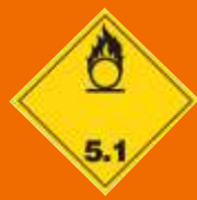
5.1. Okysličovacie látky