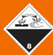
8. Žieravé látky