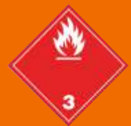
3. Horľavé kvapaliny