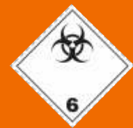
6.2. Infekčné látky