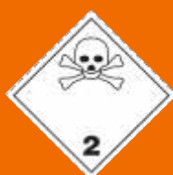
2.3. Jedovatý plyn