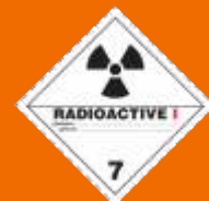
7. Rádioaktívny materiál