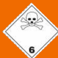
6.1. Jedovaté látky