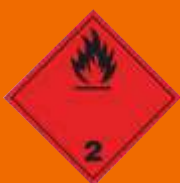
2.1. Horľavý plyn