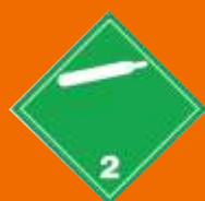
2.2. Nehorľavý plyn