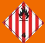
4.1. Horľavé pevné látky