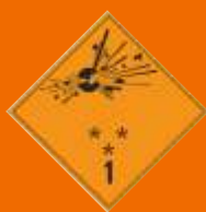
1. Výbušné látky a predmety

To, že ide o nebezpečný tovar, vám veľakrát napovedia štítky, ktoré nájdete na jeho obale (viď obrázky). Ľudia, žiaľ, často odstránia z obalu výrobku nálepky varujúce pred nebezpečenstvom bez toho, aby si overili ich opodstatnenosť. Každá látka, ktorá je nebezpečná pre životné prostredie, zdravie i prepravu, má aj tzv. kartu bezpečnostných údajov (KBU). Získať ju môžete od výrobcu alebo distribútora tovaru. Na základe KBU následne vyškolený zamestnanec TNT posúdi, či a ako je možné tovar uvedeného typu a množstva prepraviť cez našu sieť.