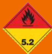
5.2. Organické peroxidy