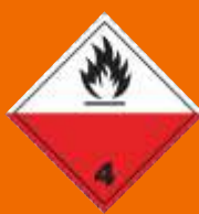
4.2. Samozápalné látky